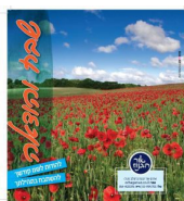
ברכון תודה והודאה להשם יתברך

ועוד מניי חינום בדואר לחצי שנה על העלון אור הגנוז