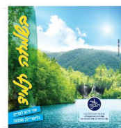
תפילות וסגולות לשמחה